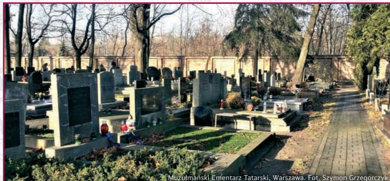
Muzułmański Cmentarz Tatarski, Warszawa.