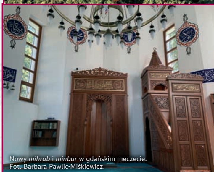
Nowy mihrab i minbar w gdańskim meczecie.