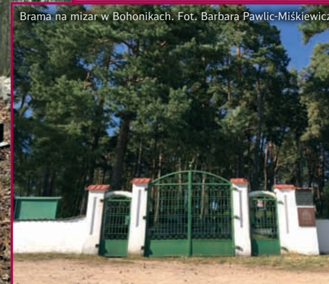
Brama na mizar w Bohonikach.