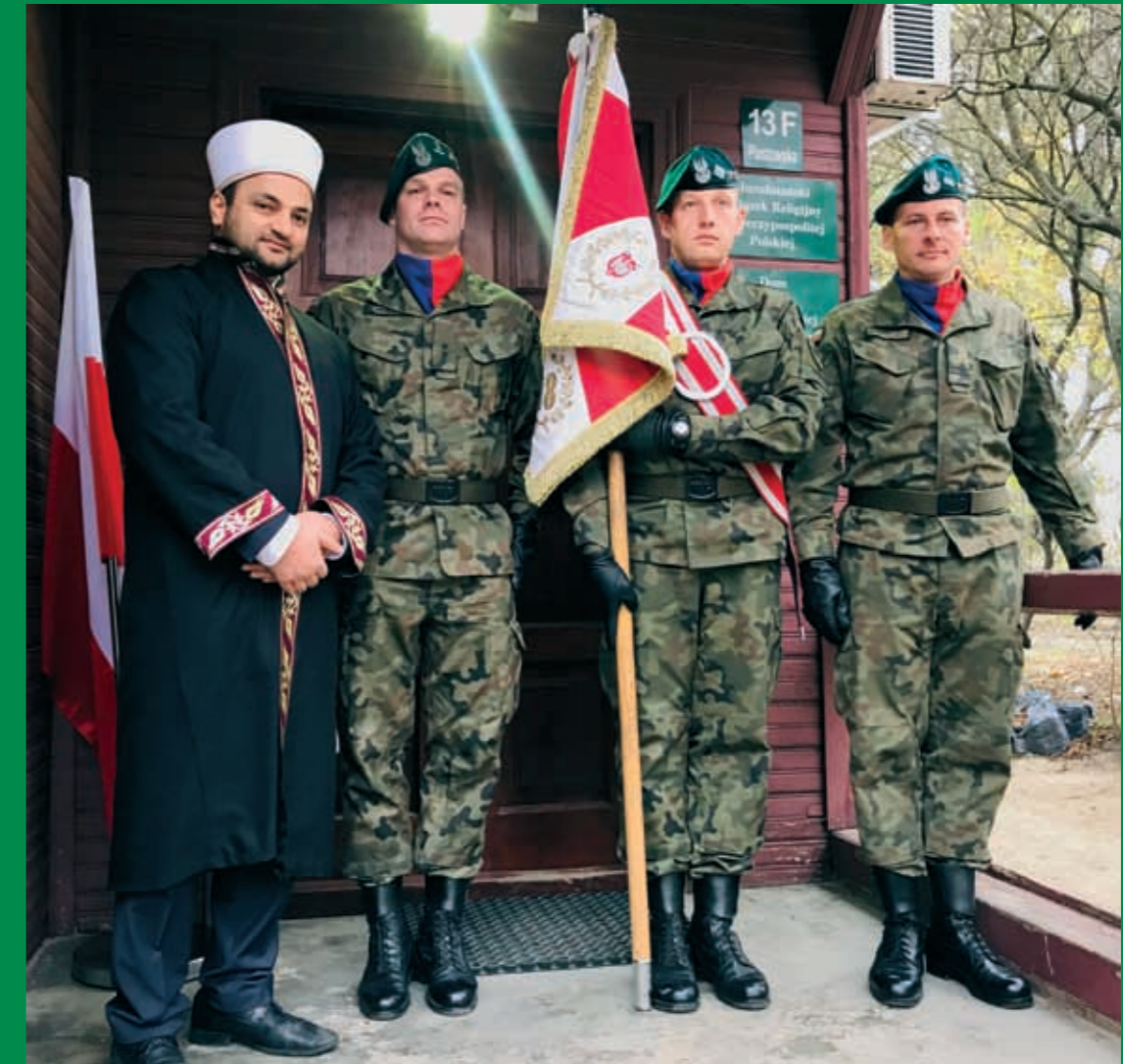
Modlitwa w intencji Ojczyzny (str. 1).

NR 1 (45) ROK 1441/2020 (XII) ISSN 2080-0541