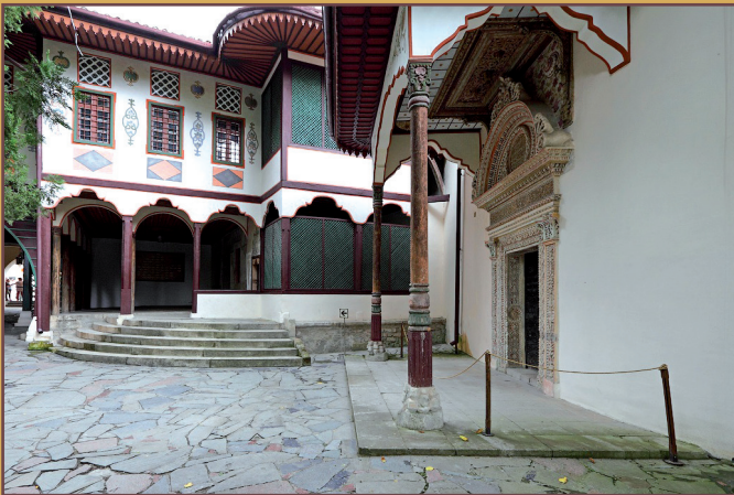
Główna część pałacu, po prawej – Żelazne Drzwi, czyli Portal Alewiza.