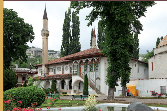
Wielki Meczet Chański.