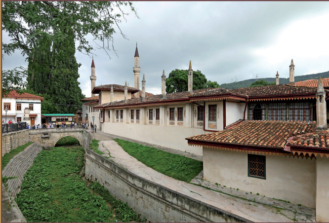
Widok na Pałac Chański w Bachczysaraju.