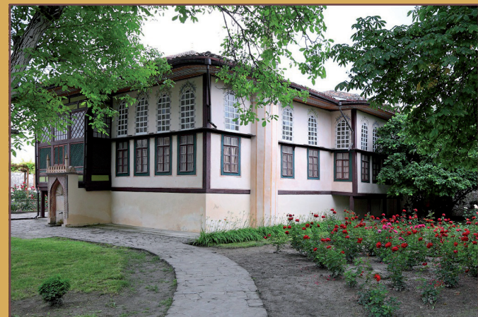
Skrzydło haremowe Pałacu Chańskiego.