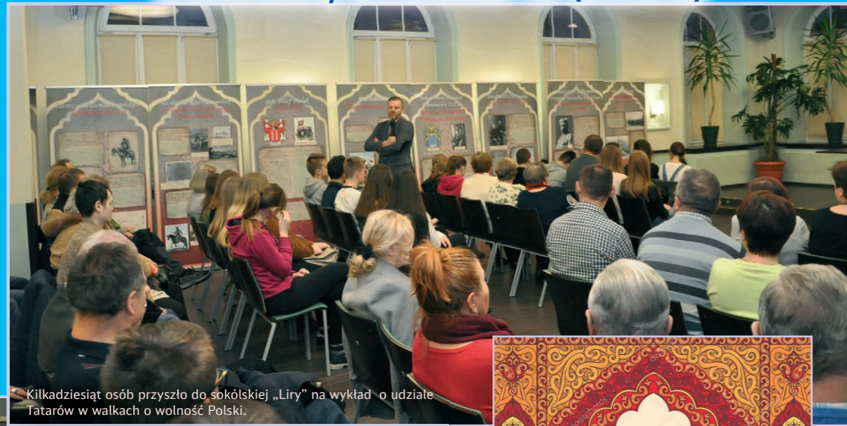
Kilkadziesiąt osób przyszło do sokólskiej „Liry” na wykład o udziale Tatarów w walkach o wolność Polski.