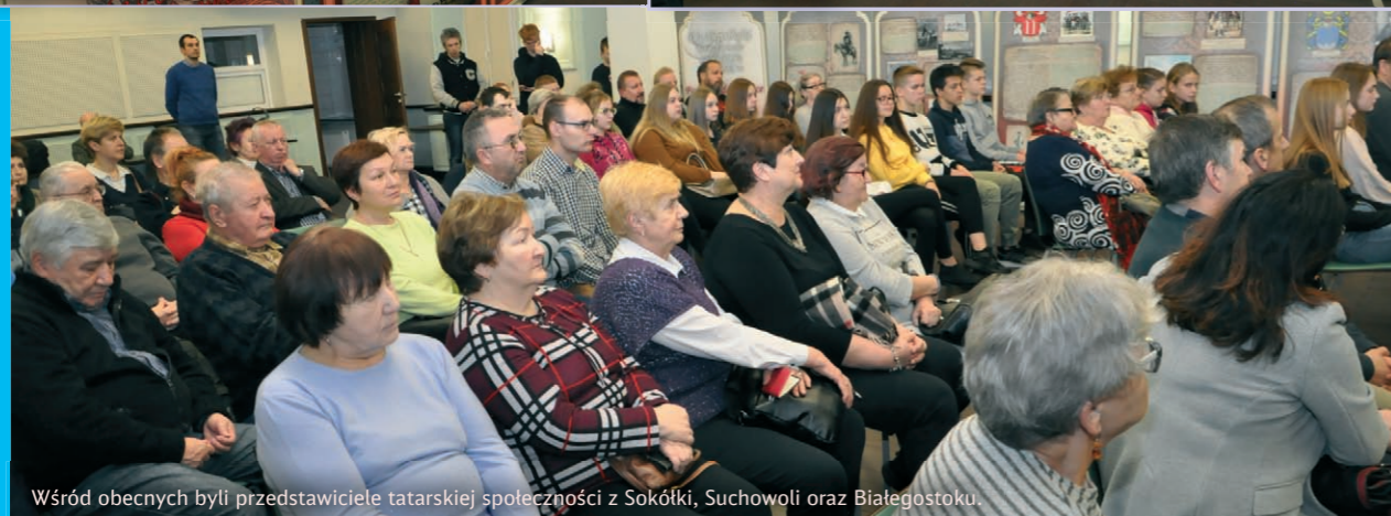
Wśród obecnych byli przedstawiciele tatarskiej społeczności z Sokółki, Suchowoli oraz Białegostoku.