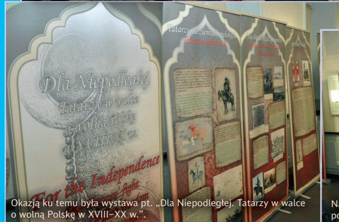
Okazją ku temu była wystawa pt. „Dla Niepodległej. Tatarzy w walce o wolną Polskę w XVIII–XX w.”