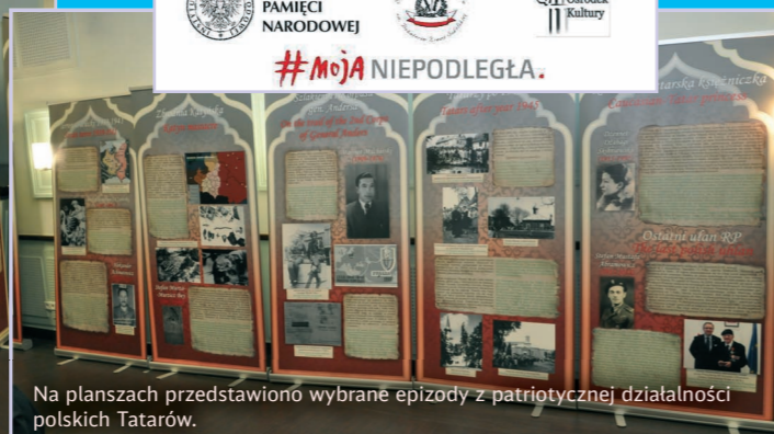
Na planszach przedstawiono wybrane epizody z patriotycznej działalności polskich Tatarów.