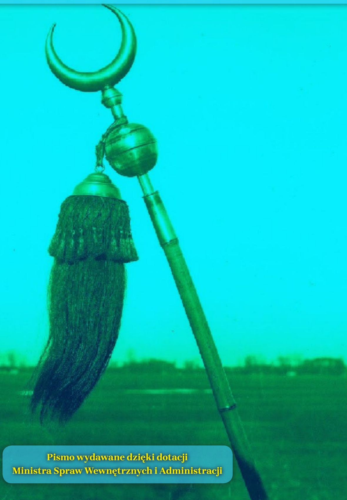
Buńczak, 1 Pułk Strzelców Konnych

Pismo wydawane dzięki dotacji Ministra Spraw Wewnętrznych i Administracji